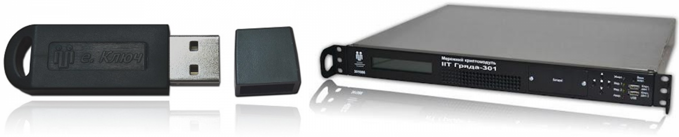
Рисунок 5.2 - Приклад зовнішнього вигляду захищених носіїв особистих ключів

ШБО використовує два типи токенів безпеки – програмні та апаратні (рис. 5.2). Програмний токен безпеки (який створюється в процесі ініціалізації нового ШБО) використовується для зберігання ключів автентифікації. Апаратні використовуються для зберігання ключів підписання та шифрування та підключаються до апаратного забезпечення, на базі якого функціонує ШБО.